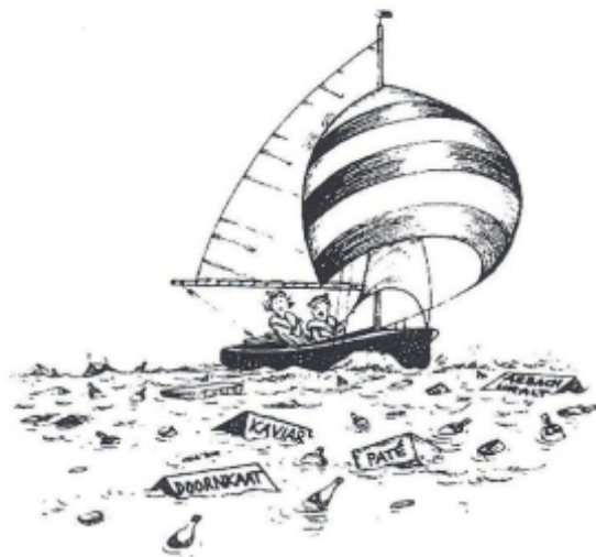
Bild aus Segelschule: Hörli und seine Mannschaft waren wieder unterwegs

Nachdem die meisten Lokale in Starigrad noch im Winterschlaf lagen,