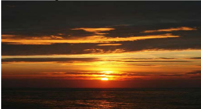
Abendstimmung am Atlantik