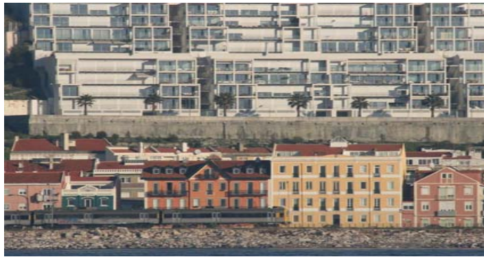
Uferblick - Modelleisenbahn ?