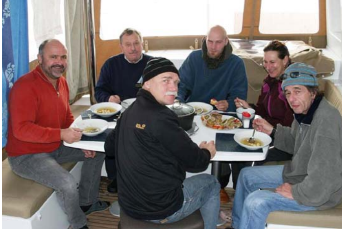
Ein Abendessen im „Wintergarten“ der EL GRECO IV