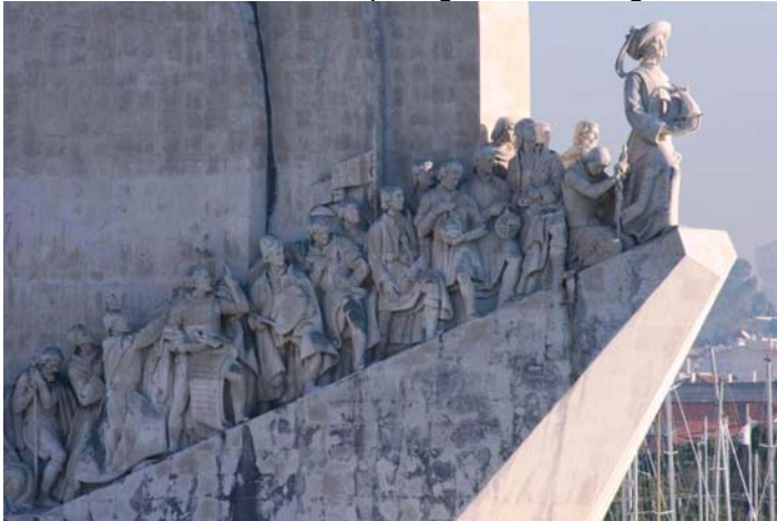
Heinrich - der seefahrende portugiesische Königssohn