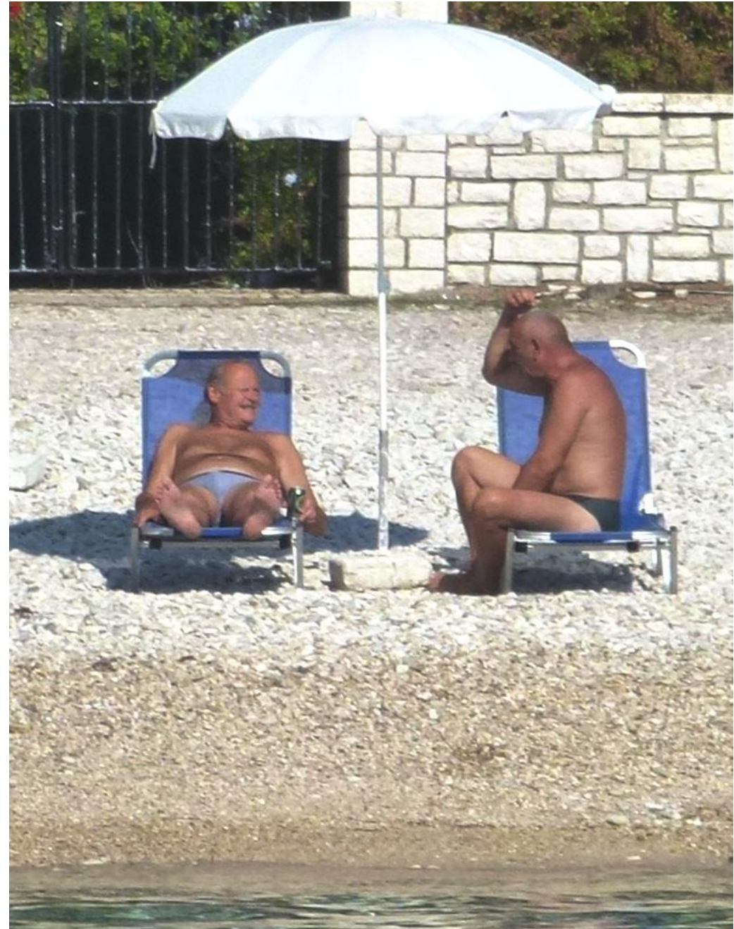
Der Bojenfänger von Kerasa