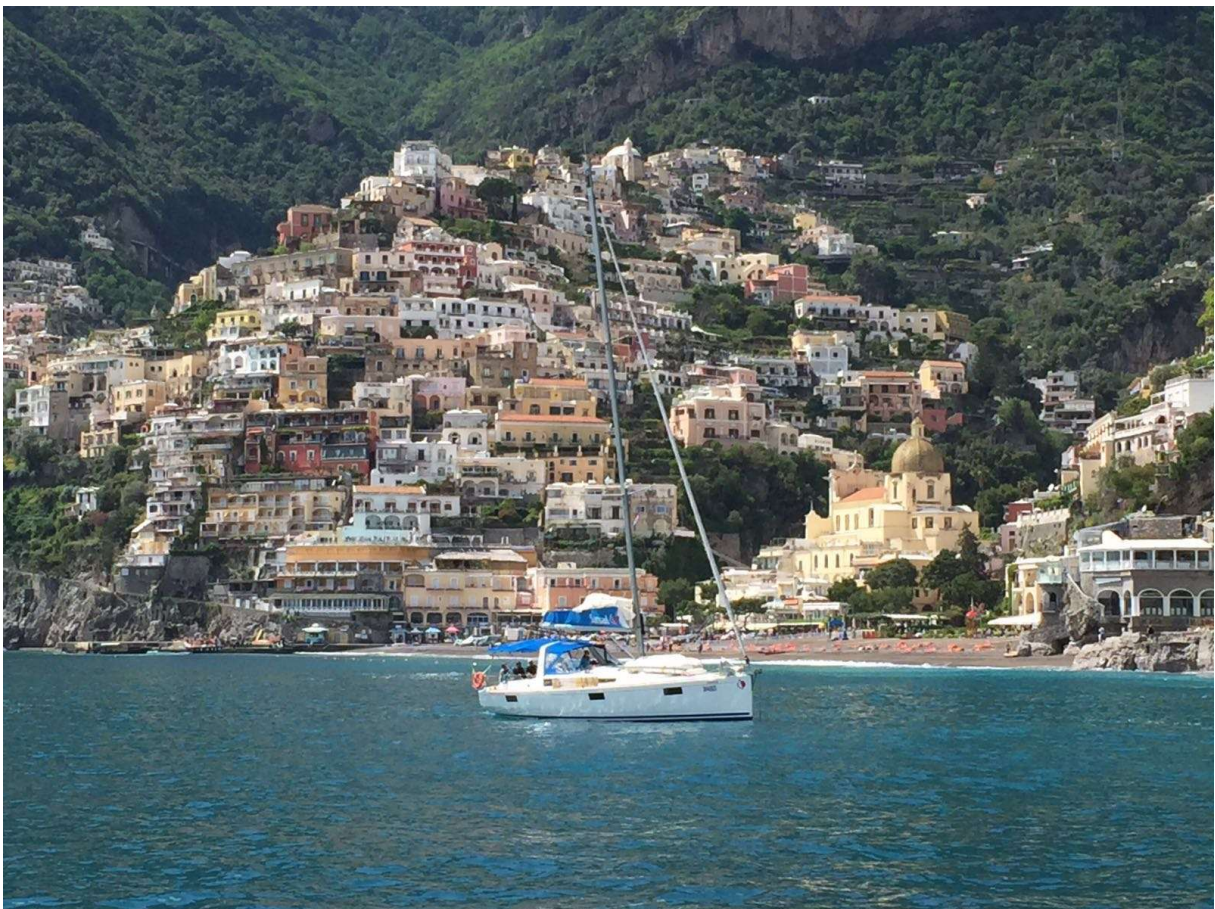
Positano an der Costa Amalfitana