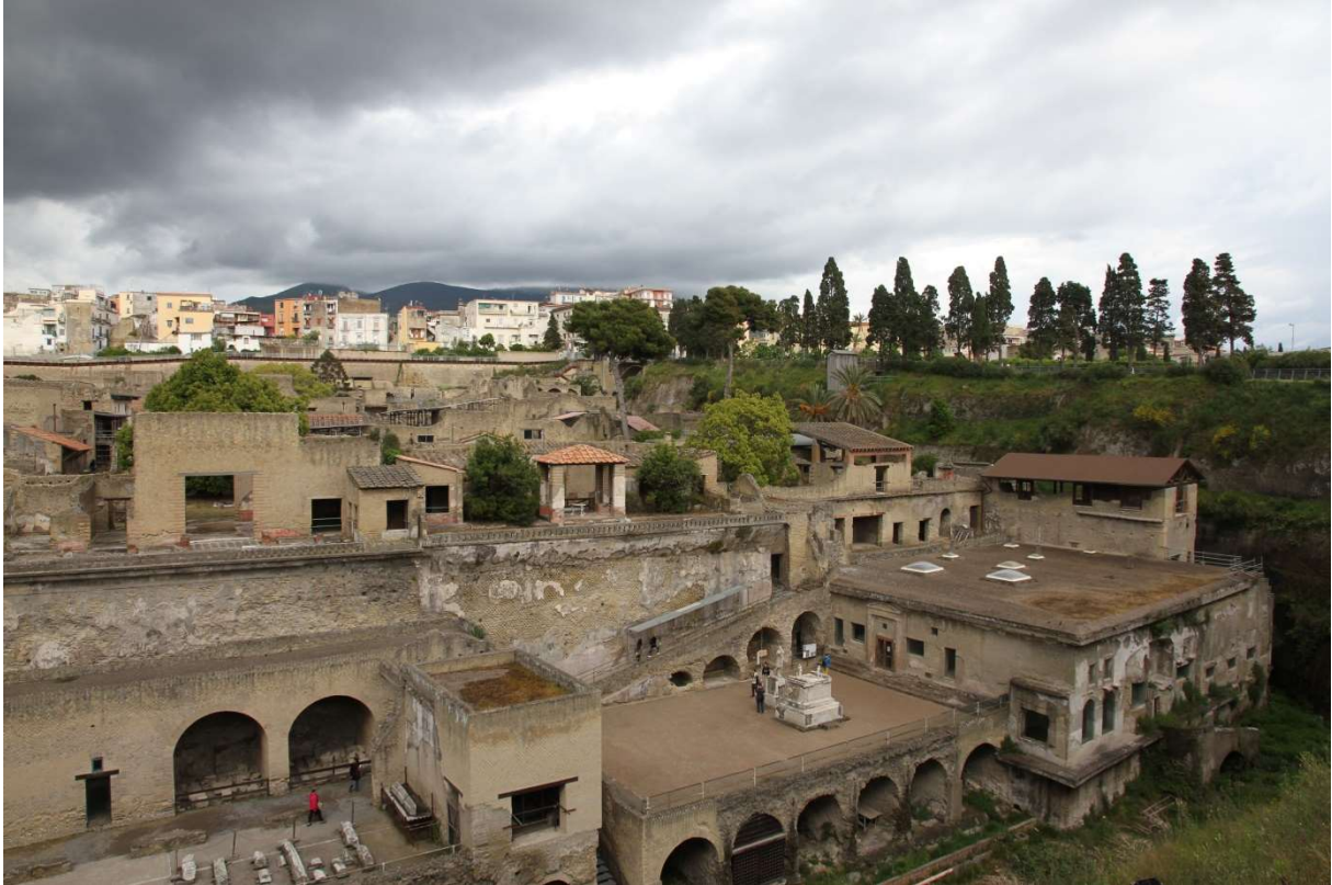
Ausgrabungen der antiken Stadt Herculaneum (verschüttet durch den Vesuv 79 n. Chr.)