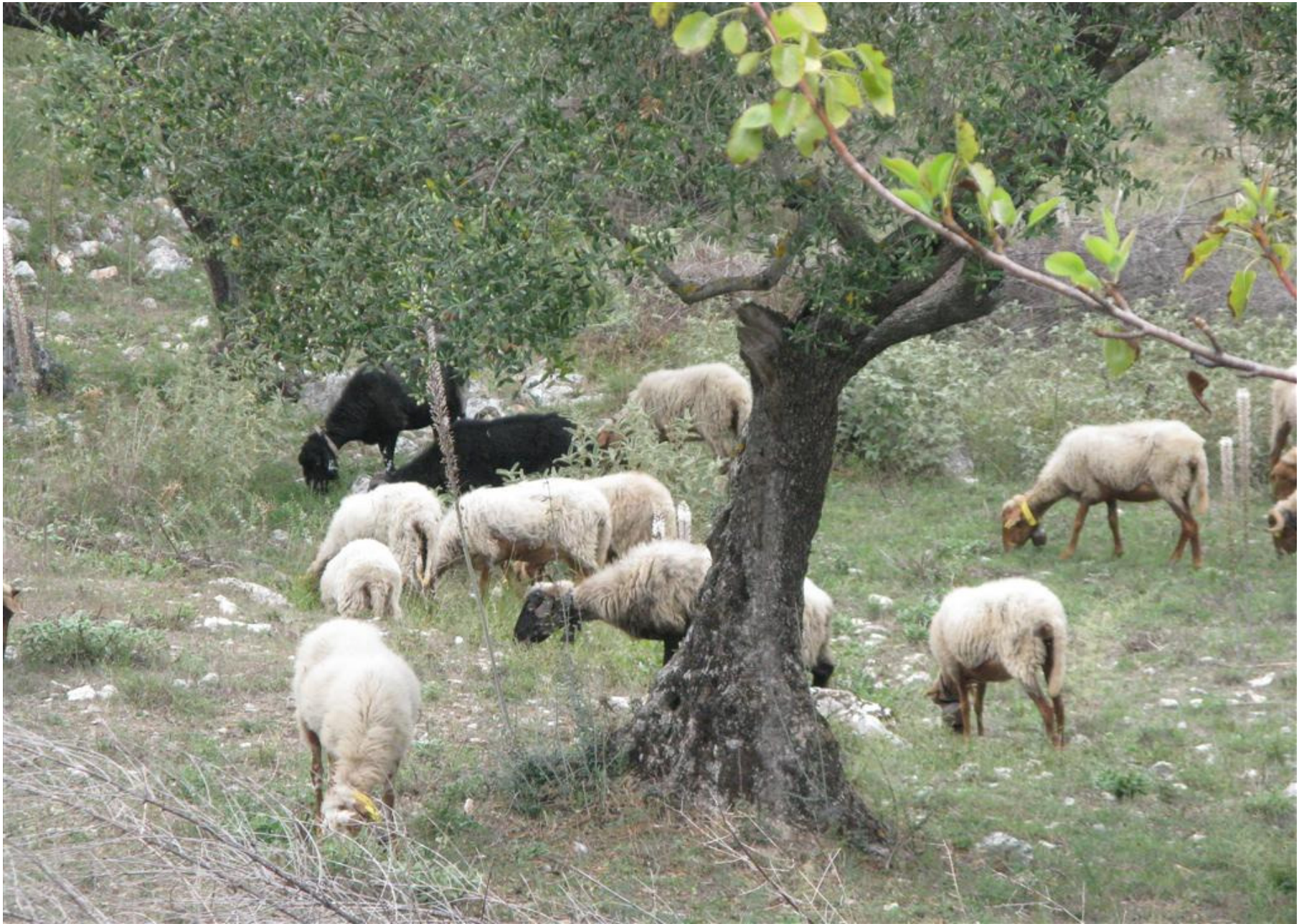
Einige hungrige Gefährten blieben auf Ithaka zurück – schwarze Schafe auch !