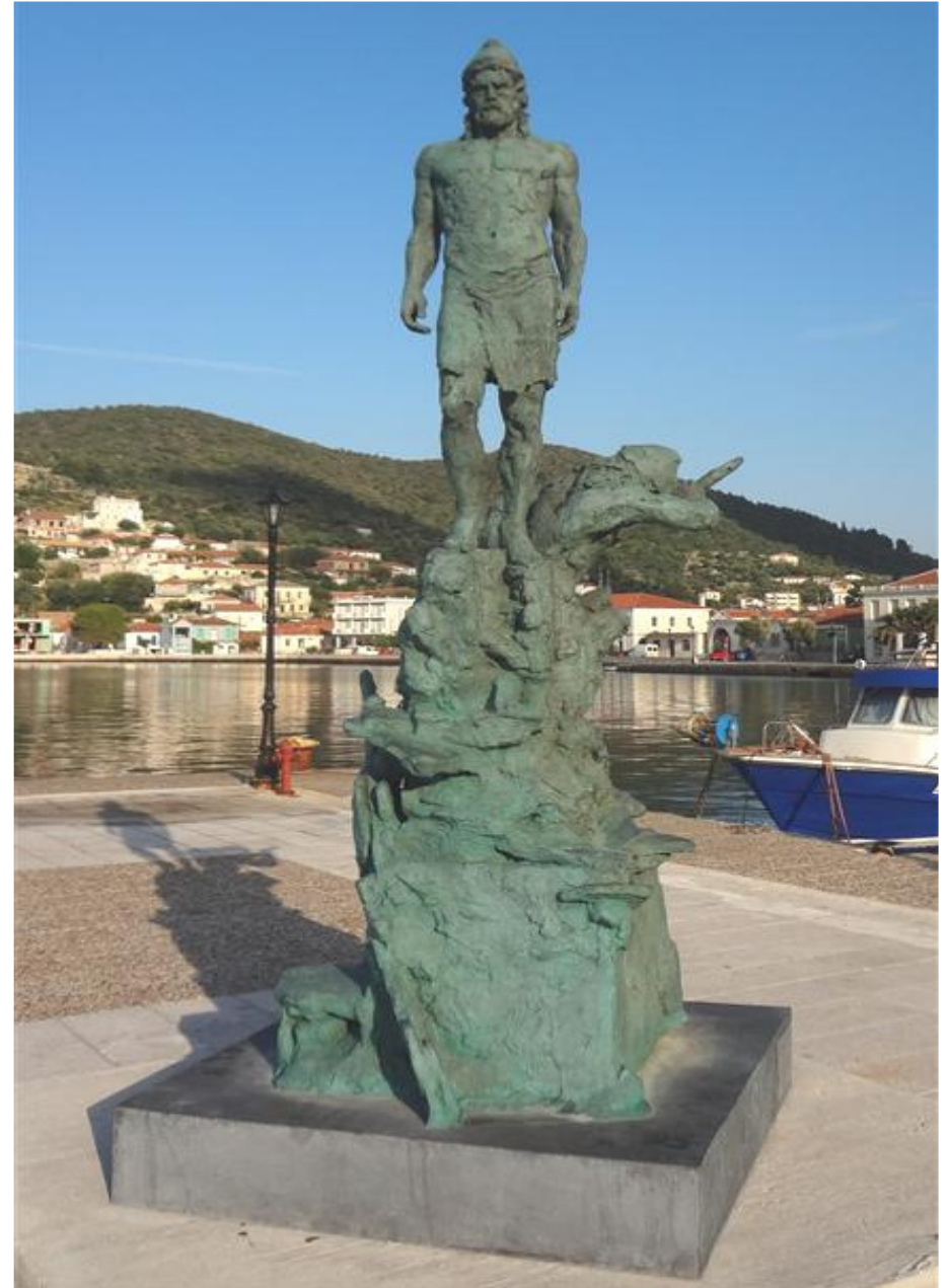
Odysseus' Gefährt(en) von heute und der alte Irrfahrer aus Homers Zeiten, allerdings in der Ausführung am Kai von Vathi aus 2011 !