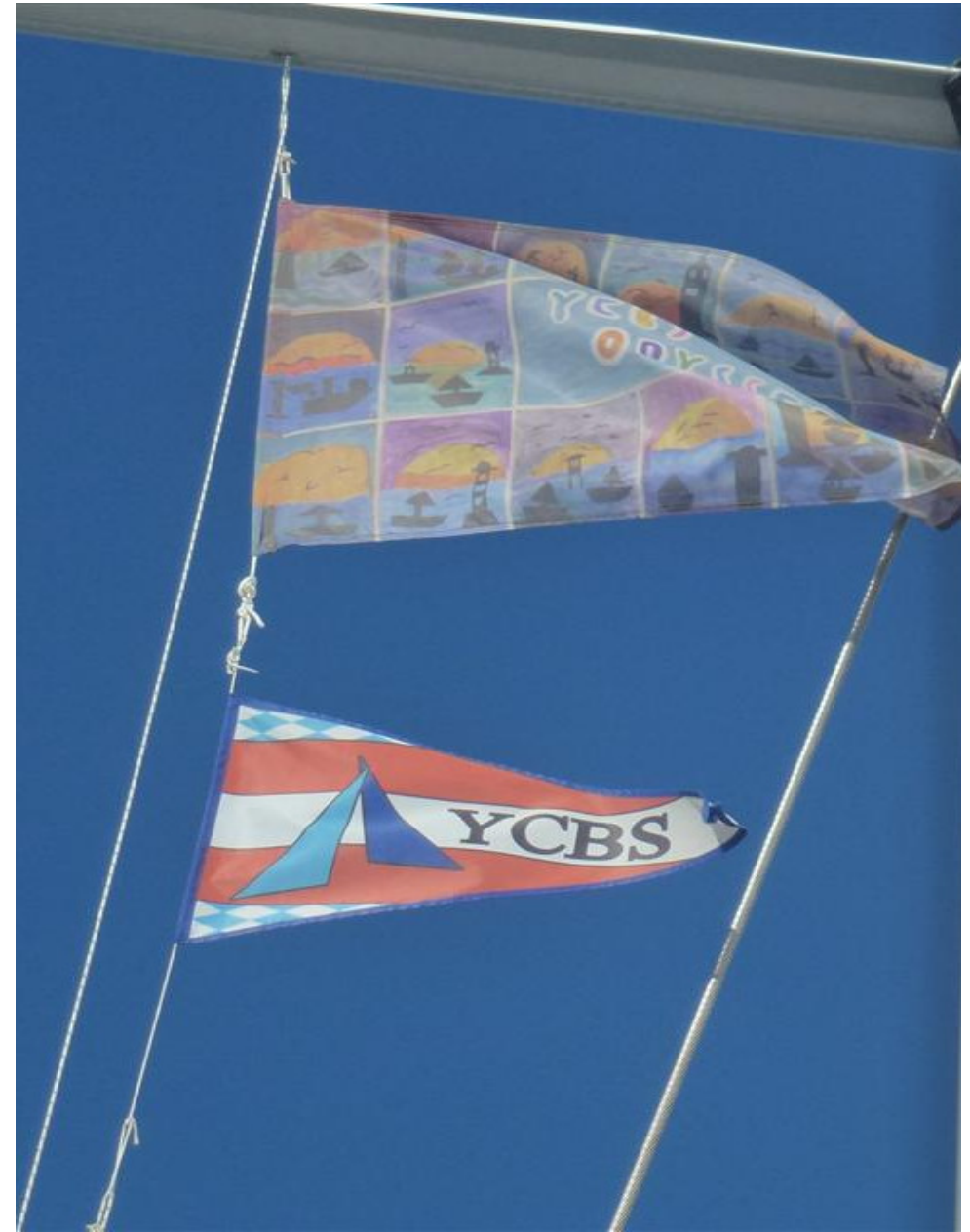
Die YCBS-Odyssee läuft unter vollen Segeln dem Ende entgegen !